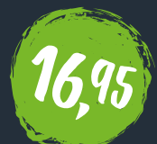
Pakket 3 - 4 flesjes + glas