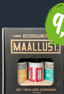
Pakket 1 - 3 flesjes

Quadrupel 1818 3,90 Blond De Weldoener 2,85 Bock Veldwachter 3,00 Tripel Zware Jongen 3,00 Vienna De Vagebond 2,70 Vreemdeling 3,35 Dubbel Mooie Madam 2,90 Weizen De Kolinist 2,70 Barleywine M10 3,60 Lentebock De Deerne 2,85 Tafelbier 2,60