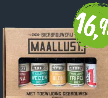
Pakket 2 - 5 flesjes